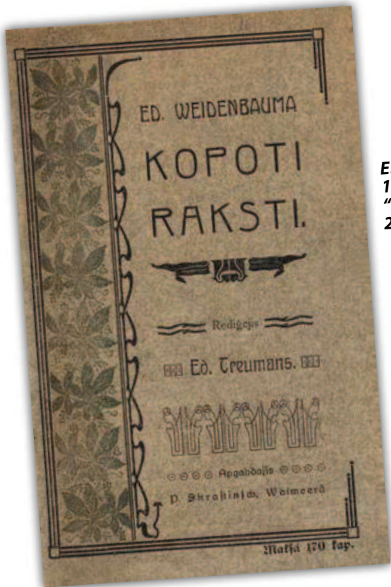
E. Weidenbauma 1908.gadā izdoto "Kopoto rakstu" 2.sējums