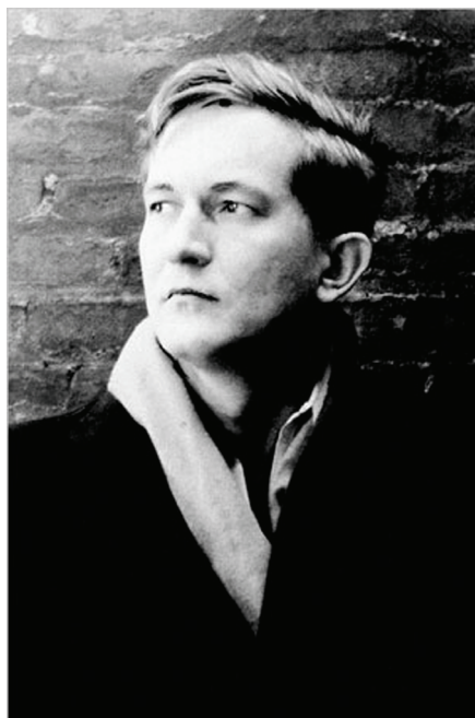
Viljams Stairons 1951.gadā.

“Open Road Integrated Media” iecerējusi izdot ne vien V.Stairona, bet arī Airisas Mērdokas (1919–1999) un Peta Konroja ( Pat Conroy , 1945) darbus e-grāmatās. Sabiedrībai kļūšot pieejams arī Džozefa Hellera ( Joseph Heller , 1923–1999) romāns “Āķis 22”, ko 1961.gadā iespieddarba formā pirmoreiz izdeva apgāds “Simon&Schuster”. Tā ir koledžas studentu obligātā lasāmviela, kas pērn pārdota 85 000 eksemplāros.